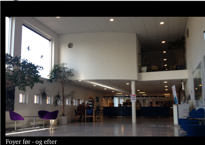
Foyer før - og efter